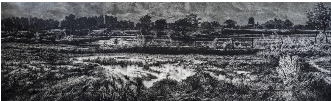
ภาพที่ 3 ผลงานสร้างสรรค์ ชื่อผลงาน แผ่นดินแห่งความหวัง ขนาด 120X450 เซนติเมตร เทคนิค สีน้ำมันบนผ้าใบ

5.2 ผลการสร้างสรรค์ในกระบวนการสร้างสรรค์ผลงานวิทยานิพนธ์ในครั้งนี้ ได้มีการ ดำเนินการตามขั้นตอนอย่างเป็นระบบ เริ่มต้นจากการเก็บข้อมูล นำมาวิเคราะห์เลือกสรรข้อมูลที่ เกี่ยวข้องเพื่อนำไปใช้ประโยชน์ในการสร้างสรรค์ ประเด็นสำคัญในการหาแรงบันดาลใจ เลือกหัว หัวข้อที่ตนเองถนัดและชื่นชอบแล้วเลือกข้อมูลที่ใกล้ตัว และผู้สร้างสรรค์เองมีประสบการณ์เพื่อถ่ายทอด ความเข้าใจและความลึกซึ้งเชื่อมโยงกับแนวความคิดในการสร้างสรรค์ มุ่งเน้นไปที่แผ่นดินแห่ง ความหวัง โดยใช้แปลงนาหรือพื้นที่ทางการเกษตรมาใช้ในการสื่อความหมายอันเป็นพื้นที่หากิน ของบุคคลในครอบครัว ผู้สร้างสรรค์เองมีประสบการณ์ในการทำไร่ทำนาและเห็นคนในครอบครัว ลำบากตรากตรำ เหน็ดเหนื่อยต่อสู้ดิ้นรนเพื่อชีวิตที่ดีขึ้น จากแรงบันดาลใจตรงนี้ผู้สร้างสรรค์จึง ตีความเป็นเรื่องของความหวังในชีวิต จึงใช้รูปทรงของทิวทัศน์เป็นรูปทรงใหญ่มีรายละเอียดเนื้อหา ของพืช แปลงนา รอยไถ แหล่งน้ำ แสดงออกในรูปแบบเหมือนจริง ผ่านทิวทัศน์ขาวดำ สีดำแทน ทัศนคติด้านลบในใจที่มีต่อความลำบากเหน็ดเหนื่อยของบุคคลในครอบครัว เป็นมุมมองที่ผู้ สร้างสรรค์มองอย่างลึกซึ้งลงไป เห็นมิติการดำเนินชีวิตของคุณคน