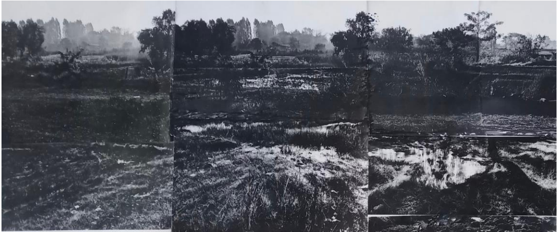
ภาพที่ 2 ภาพร่างผลงาน