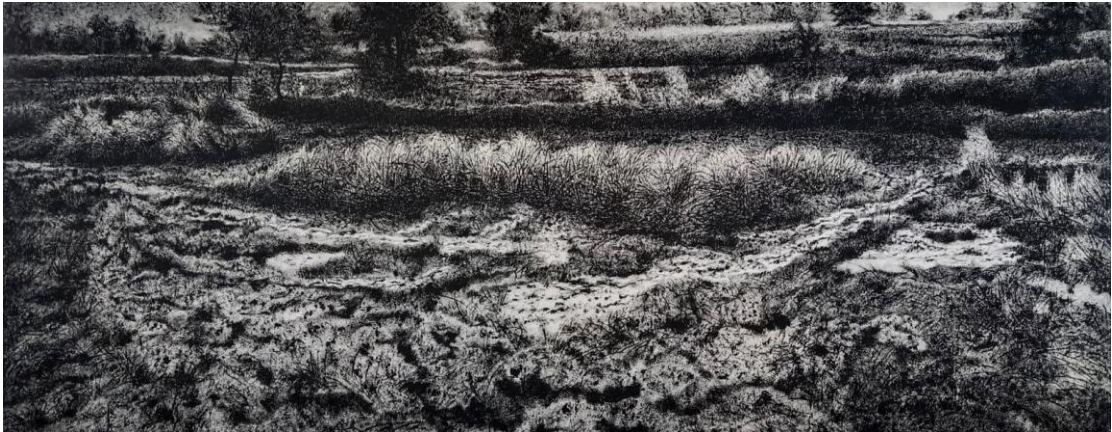
ภาพที่ 4 ผลงานสร้างสรรค์